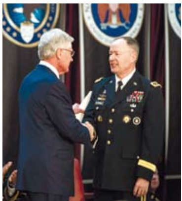
「美國－東盟防務論壇」在夏威夷落幕，會後美國國防部長哈格爾將造訪亞太。 圖為3月28日，美國國防部長哈格爾(右二)出席現任國安局局長的退休儀式。

哈格爾說，他期待在訪華期間與中方領導人會晤，雙方可以討論如何在現有合作領域繼續推進合作，美方願意繼續與中方加強合作；他也將與中方在南海問題等問題上交換意見，他願意聽取中方的看法。不過分析人士認為，聽其言尚需觀其行。不要忘記，構建互信需要「雙邊行動」。