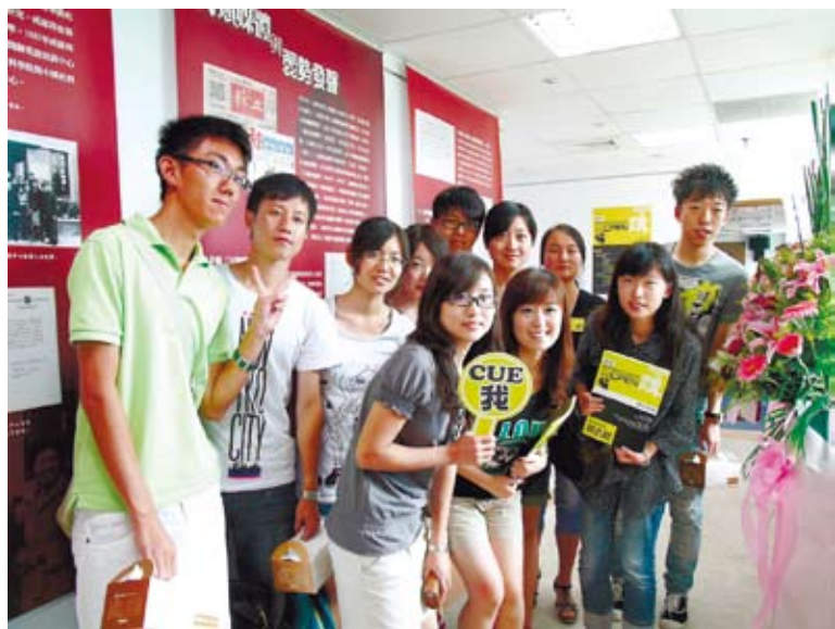
面對越來越多願提供陸生友善學習環境的社會呼聲，或許是該重新檢討「三限六不」實現學生平權的時候了。（本報資料照片）

台生、陸生、外籍生團結起來爭取校內工作權益，是台灣學生運動不被國籍區隔權益的開端。我們期許這一運動的繼續發展，也期待各種單獨針對特定國籍學生的歧視性管制（例如，當前在台陸生遭遇的「沒有健保」或「三限六不」，外籍生或僑生大多都無此困擾），能盡速從台灣的高等教育環境中消逝。換一個平等的高教未來。