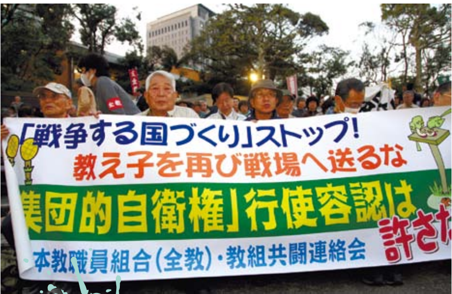
日本民眾舉行大型集會反對解禁集體自衛權 圖為4月8日，日本民眾在東京參加大規模示威活動，反對安倍政府修改憲法和解禁集體自衛權的企圖。