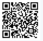
拜訪兩岸新報的網頁