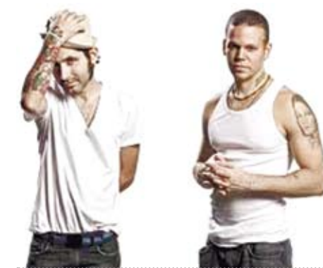
十三街 (Calle 13) 是當代波多黎各的一個樂團，堪稱為拉丁美洲新歌的當代傳人。

Soy, Soy lo que dejaron. Soy toda la sobra de lo que se robaron. Un pueblo escondido en la cima, mi piel es de cuero por eso aguanta cualquier clima. Soy una fábrica de humo, mano de obra campesina para tu consumo Frente de frio en el medio del verano, el amor en los tiempos del cólera, mi hermano. El sol que nace y el día que muere, con los mejores atardeceres. Soy el desarrollo en carne viva, un discurso político sin saliva. Las caras más bonitas que he conocido, soy la fotografía de un desaparecido. Soy la sangre dentro de tus venas, soy un pedazo de tierra que vale la pena. soy una canasta con frijoles, soy Maradona contra Inglaterra