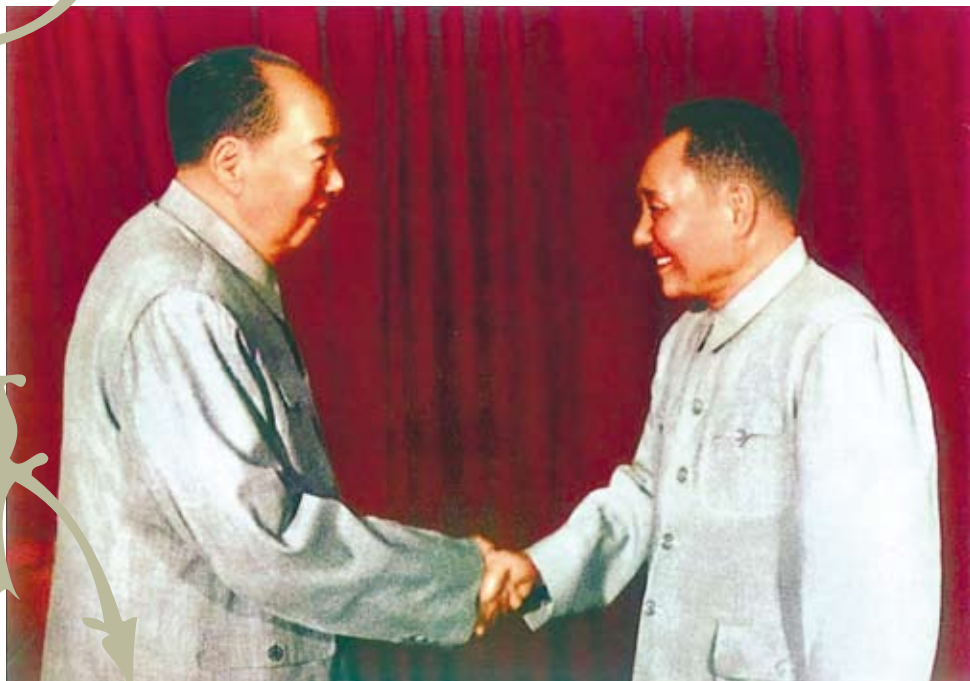
毛澤東死後，鄧小平及時改弦更張，不但挽救了中國，還使中國繼續往前發展。